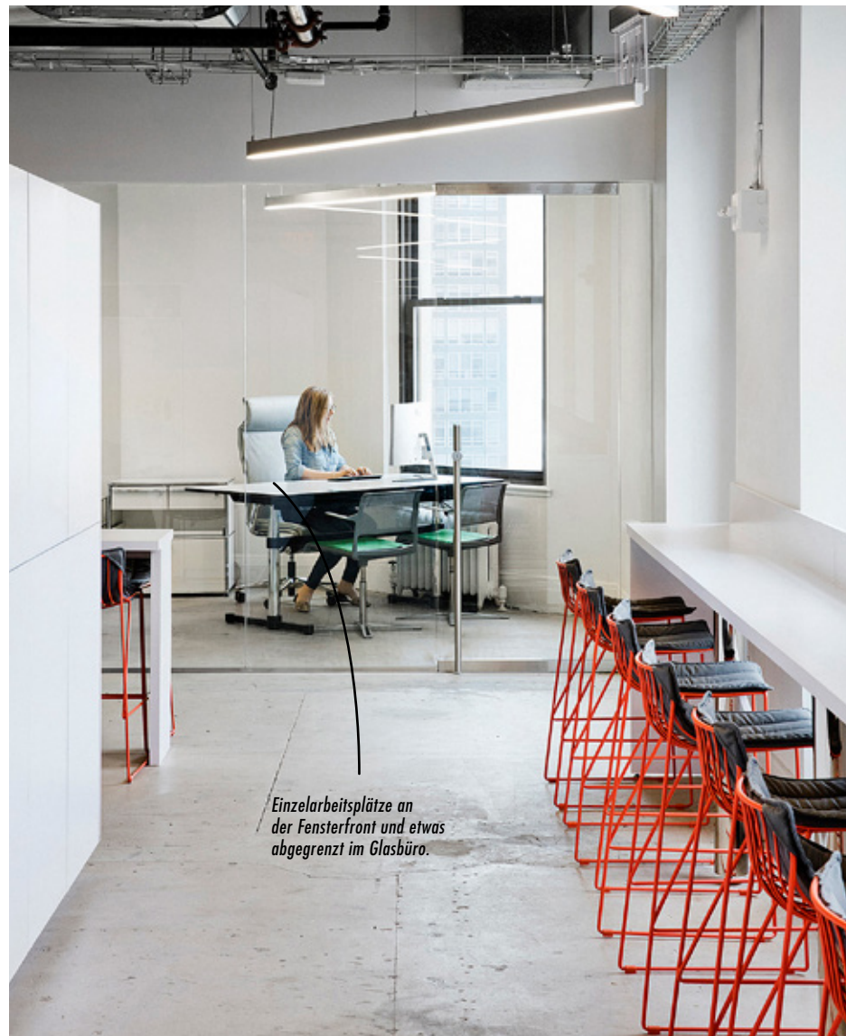
Einzelarbeitsplätze an der Fensterfront und etwas abgegrenzt im Glasbüro.

Hier arbeitet: Zags ist ein Start-up-Unternehmen mit Hauptsitz in New York. Für Versicherungsunternehmen auf der ganzen Welt entwickelt es Software-Technologie, die intern die Organisation erleichtert. ros